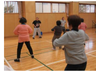
躍動的で楽しいフレッシュシニア体操