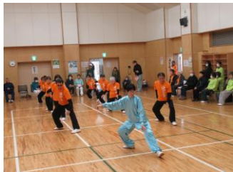
心を集中してゆったりと太極拳