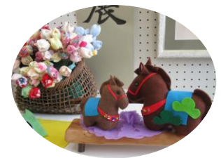
かわいいぬいぐるみや造花に癒されます