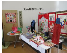
手編みのセーターや小物、まさに芸術品