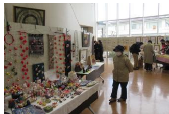
ロビーでは手作りの見事な作品が展示されました