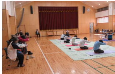
バランスよく体を整えるヨガ