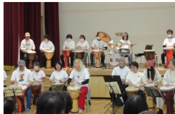
一年で迫力あるジャンベを演奏することが出来ます