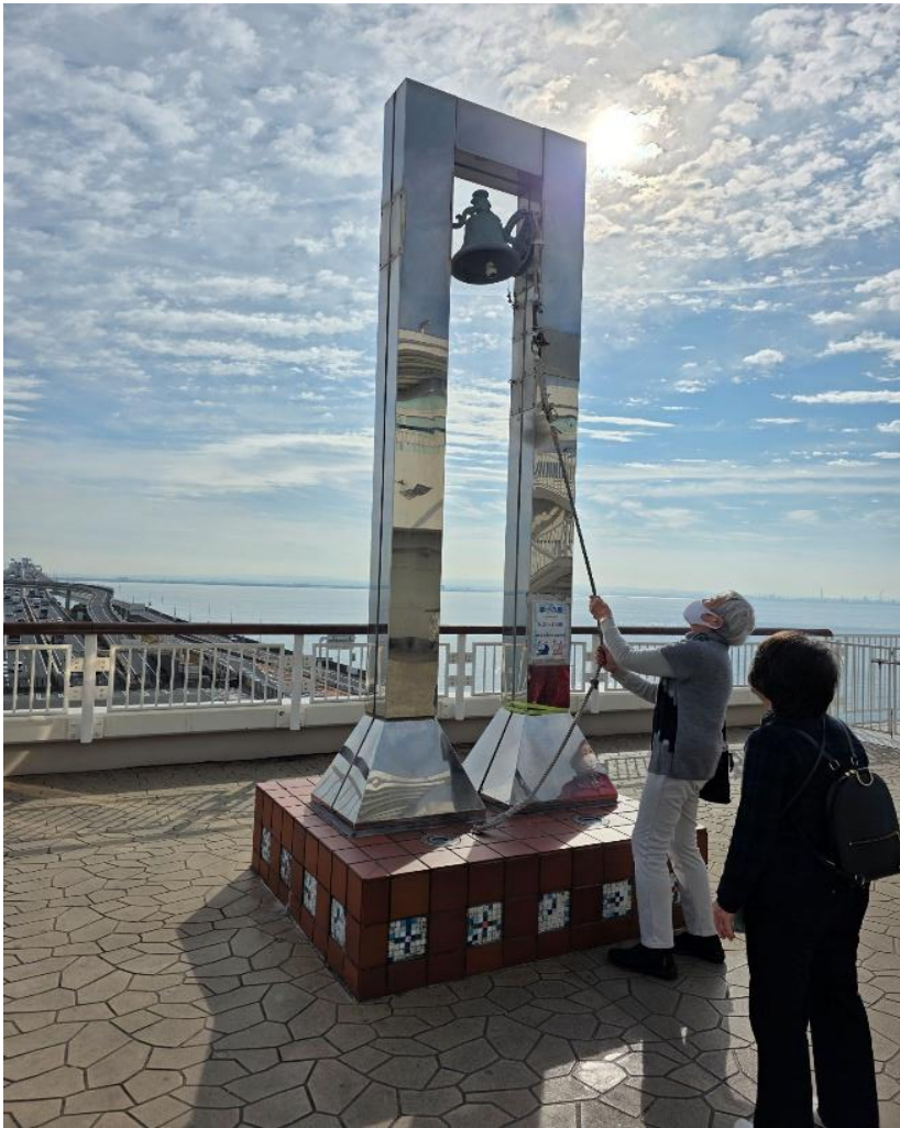
海ほたる幸せの鐘