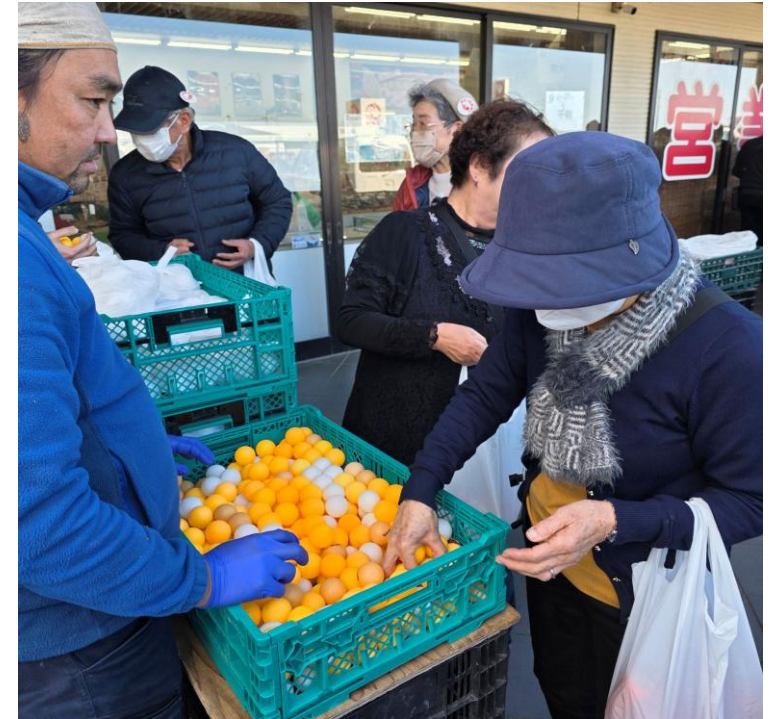
卵つかみ取り（ピンポン玉）