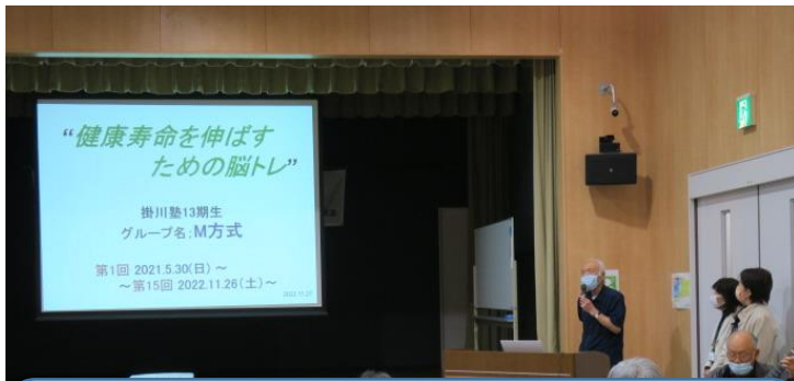
健康寿命を伸ばすための脳トレ 13期生M方式グループ 村松 直樹 様以下4名 脳の活性化、予防医療、セルフケア、癒し