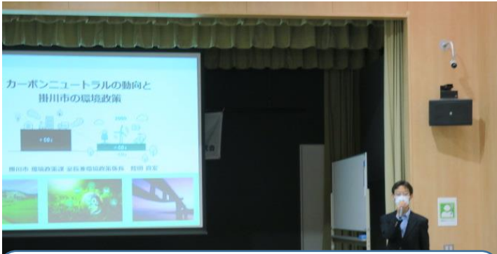
環境政策について 環境政策課再生エネルギー政策室長 睦田 真宏様 脱炭素社会の実現に向けて