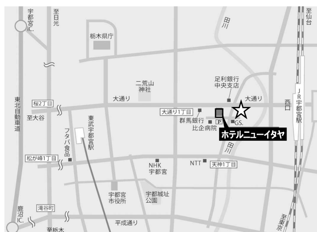
(2) ホテルニューイタヤ

★貸切バスをご利用されない場合、または乗り遅れた場合は、JR宇都宮駅西口・関東バス乗場10番より、行先番号43「長坂経由・鹿沼営業所行」にお乗りいただき、「共和大学・宇短大入口」にて下車徒歩5分。