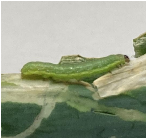
写真 シロイチモジヨトウ幼虫