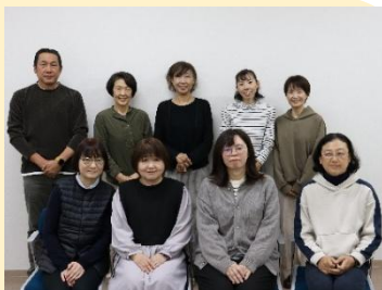
基礎研修Ⅲ受講者の皆さん

そのため私は社会福祉の視点を持ちながら、今後関わっていくクライアントの方たちに、自分のキャリア形成やメンタルヘルスケア、働きやすい職場環境づくりなどのお手伝いできればと考えています。