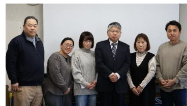
基礎研修Ⅰ受講者の皆さん

各研修が、社会福祉士としての専門性の向上と質の担保の機会として、今後も活用されることを期待しております。