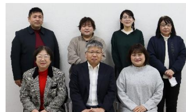
基礎研修Ⅱ受講者の皆さん