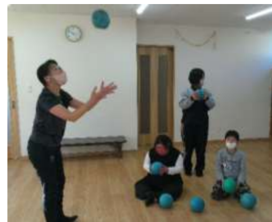
くすのき事業所では月2回体操の先生が指導にみえます。やわらかいボールを使って様々な運動機能を高めています。音楽にのったダンスも人気です