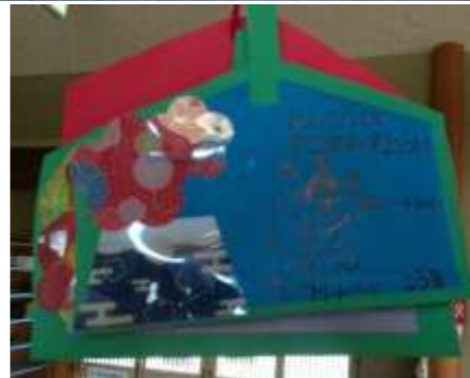
健康の願いについて、詳しく書かれています。丁寧さがいいですね