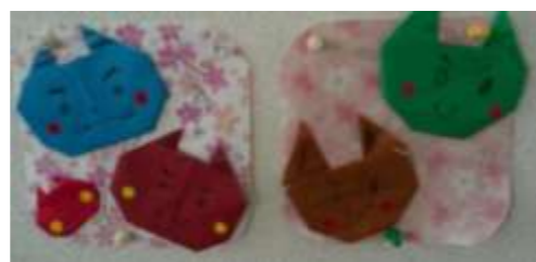
たんぽぽ事業所の壁に見つけました。←梅の花と赤鬼・青鬼のお面です。2月は梅の花が咲き春の訪れを告げます。鬼のおりがみ→かわいらしくていいですね