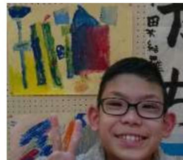
館林市三の丸芸術ホールで開催されました。デザイン画・工作・手芸・書道 力作が揃いました。ご家族で参観に見えました