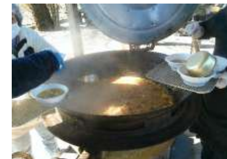
社員も総力挙げて豚汁の大鍋料理づくりです