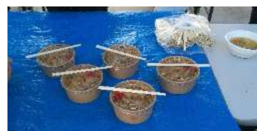
みんなの大好きな豚肉しょうが焼き弁当