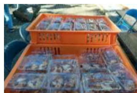
ついたお餅は餡をつけていただきました

特別なおもちとは？→昨年ハートフルふきあげの田んぼで初めて収穫したもち米でつくりました。利用者様・社員が1年間かけて大切に育てて収穫したもち米を、目の前で臼と杵で突く、そして味わう。ありがたみ一味違います