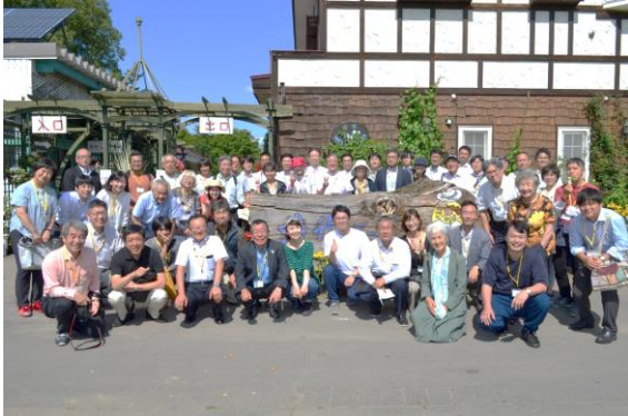
↑北海道ガーデン街道協議会メンバー