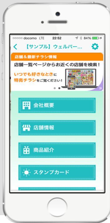
【アプリTOP画面】 ※イメージ