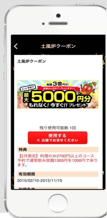
【店舗別クーポン画面】