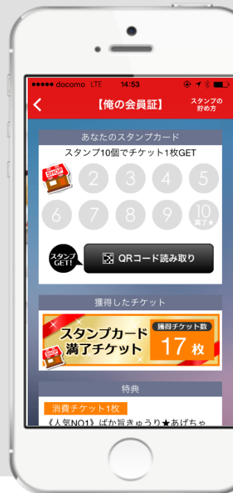
【スタンプカード画面】