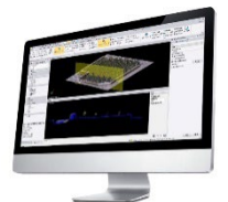
Trimble Business Center Trimble RealWorks TOWISE (オフィスソフトウェア)