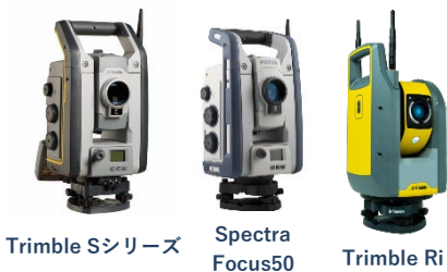
Trimble Sシリーズ Spectra Focus50 Trimble Ri

多くの機能を持つフィールド機器からオフィスソフトまでを一度に体感いただけます。是非この機会にご興味のある製品の操作性をご試用ください。会場・機材・天候により屋外でのデモンストレーションも可能な場合もございます。（下記以外に協賛各社のソリューションも展示いたします）