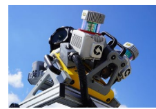
Trimble MXシリーズ (出展できない会場もございます)