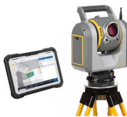
Trimble Access & フィールドソリューション