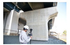
AIひび割れ解析ソリューション