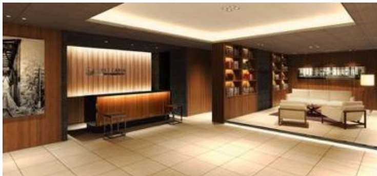
木目調で落ち着いた雰囲気フロントエリア