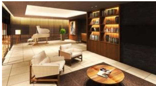
宿泊者専用のラウンジエリア