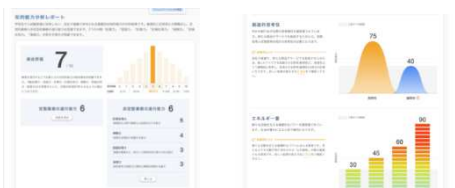
「タレントアナリティクス」による分析結果イメージ

学歴や職務経歴だけでは分からないビジネスに必要な知的能力や、面接では見抜けない性格やストレス耐性・キャリアに対する価値観を把握できます。貴重な応募者の中から企業にマッチした人材の発見を実現します。