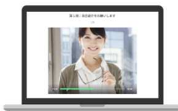
企業の撮影イメージ

撮り直し可能な動画でコミュニケーションを図ることで、場所や時間を制限されることがありません。面接官からのメッセージや面接アドバイスを伝え、求職者の企業理解の促進と面接辞退を防止します。