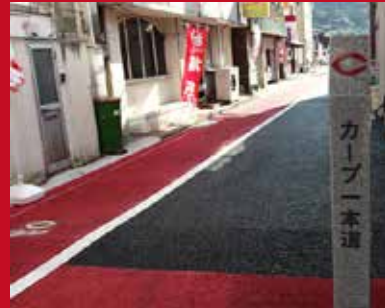
油津商店街から天福球場まで続く 「カープ一本道」