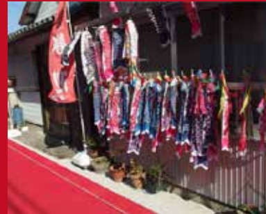
カープ一本道の道中には たくさんの鯉のぼりが飾られている