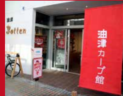
カープキャンプの歴史を知る 「油津カープ館」