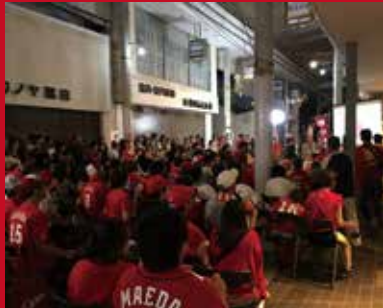
カープリーグ優勝時 多くのカープファンが集まる街

日南市と広島との一番の繋がりやはり「広島カープ」 昭和38年からカープのキャンプ地として日南市は第二の故郷となっている。