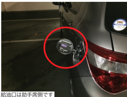
給油口は助手席側です