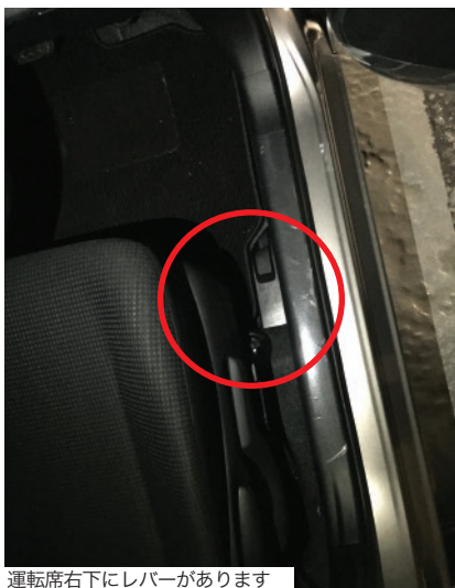
運転席右下にレバーがあります