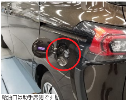
給油口は助手席側です