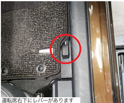
運転席右下にレバーがあります