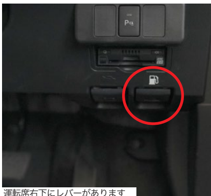
運転席右下にレバーがあります