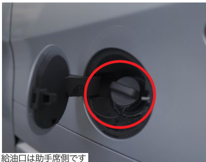
給油口は助手席側です