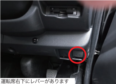
運転席右下にレバーがあります