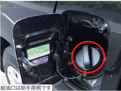
給油口は助手席側です