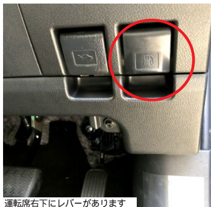
運転席右下にレバーがあります