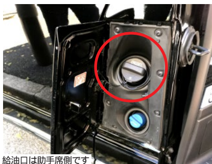
給油口は助手席側です