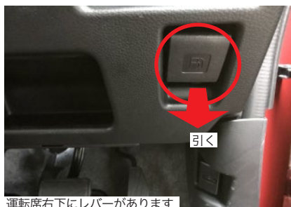
運転席右下にレバーがあります