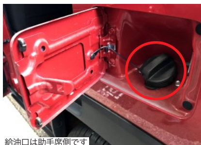
給油口は助手席側です