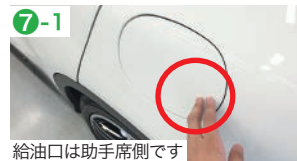
給油口は助手席側です