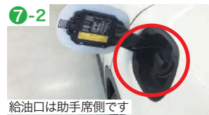
給油口は助手席側です