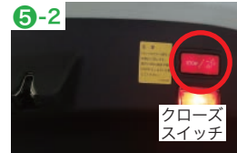
クローズ スイッチ