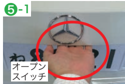
オープン スイッチ

オープンスイッチを押すと電動でバックドアが開きます。(写真⑤-1) クローズスイッチを押すと電動でバックドアが閉まります。(写真⑤-2)