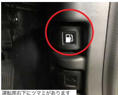
運転席右下にツマミがあります