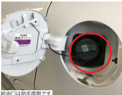
給油口は助手席側です