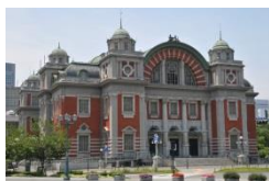
大阪市中央公会堂

美景、グルメ、文化、歴史などを切り口に、さまざまな魅力を放つ街“大阪”の、定番・おすすめの観光スポットをご紹介します！