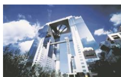
梅田スカイビル 空中庭園展望台