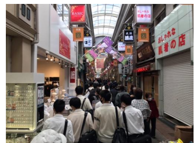
日本一長い天神橋筋商店街