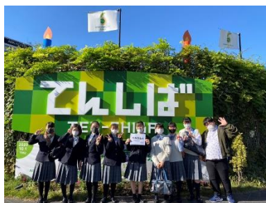
天王寺公園・てんしば