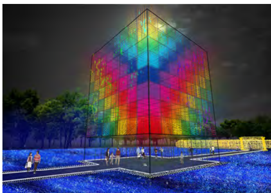
“日本初” 光のキューブ

シャンパンゴールドに包まれる「光の回廊」を抜けると目の前に広がる、一面の青い光が海のように波立つ「光のビッグブルー」。LEDが箱型の中で自由自在に動く、日本初の高さ15mの巨大キューブオブジェ「光のキューブ」も登場。