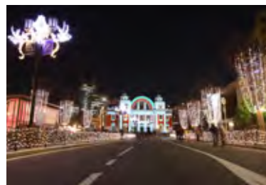
*前年までの実施風景