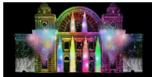
～光絵本～Winter Gift from Emirates Airline. （※イメージです。）