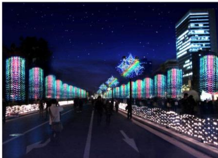
シャイニングリバー （※イメージです。）