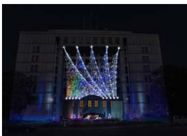
シャイニング・ゲート ～光輝く水の結晶～

※詳細は、中之島エリア（中央会場）開催概要【資料1】、中之島エリア（東会場）開催概要【資料2】をご覧ください。