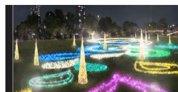
水ものがたり 2012～躍動～