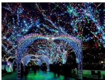
シャイニング・オアシス ～わきあがる生命の泉～