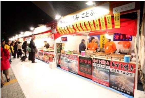
光のフードマーケット（昨年写真）