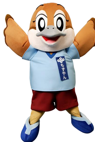
大阪府広報担当副知事もずやん