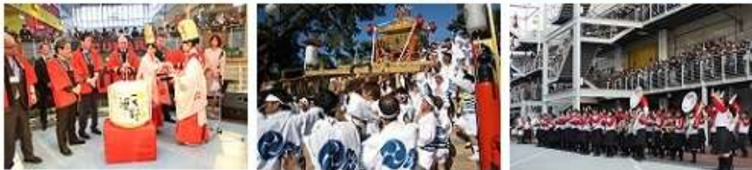
2016年3月クイーン・エリザベス初入港の際の様子(上、右下、右上)、住吉大社神輿奉昇(イメージ)(中央)