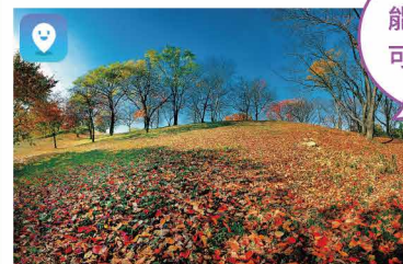
古室山古墳 Komuroyama Kofun