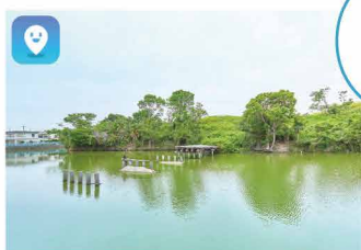
ITASUKE 古墳 Itasuke Kofun