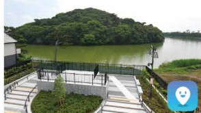
履中天皇陵古墳 Richu-tenno-ryo Kofun