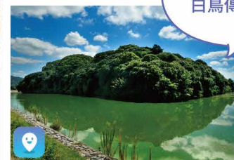
白鳥陵古墳 Hakuchoryo Kofun