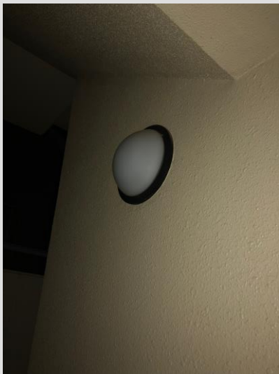
電球が完全に切れてしまっている