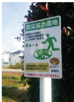
防災協力農地の表示板