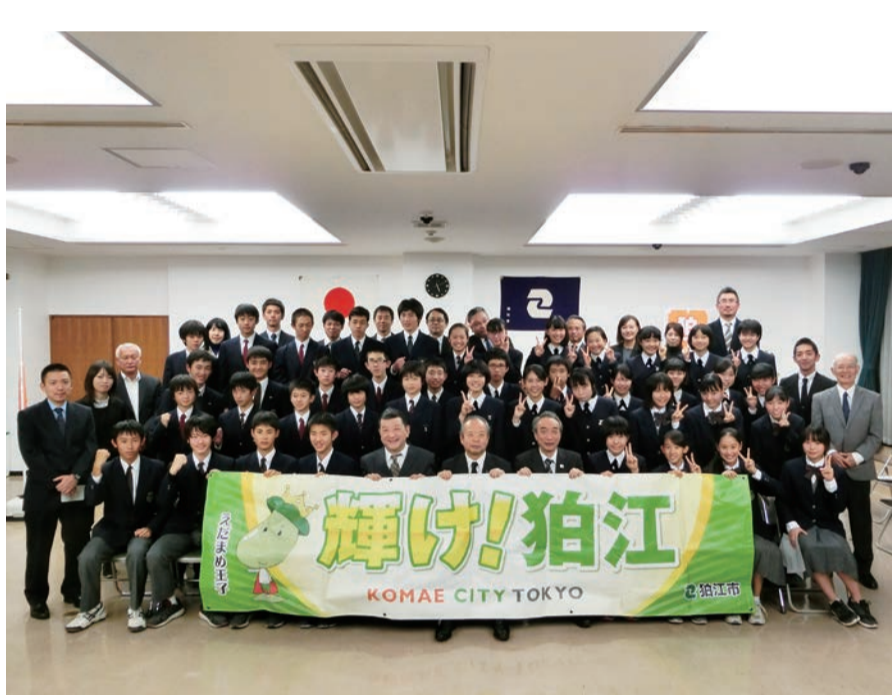
ぜひ応援に来てください