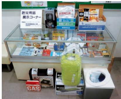
防災用品を見直してみませんか

配送料は商品の価格に含まれており、自宅または勤務先(市内に限る)に商品を配送します。 支払い商品と引き換えにお支払いください。