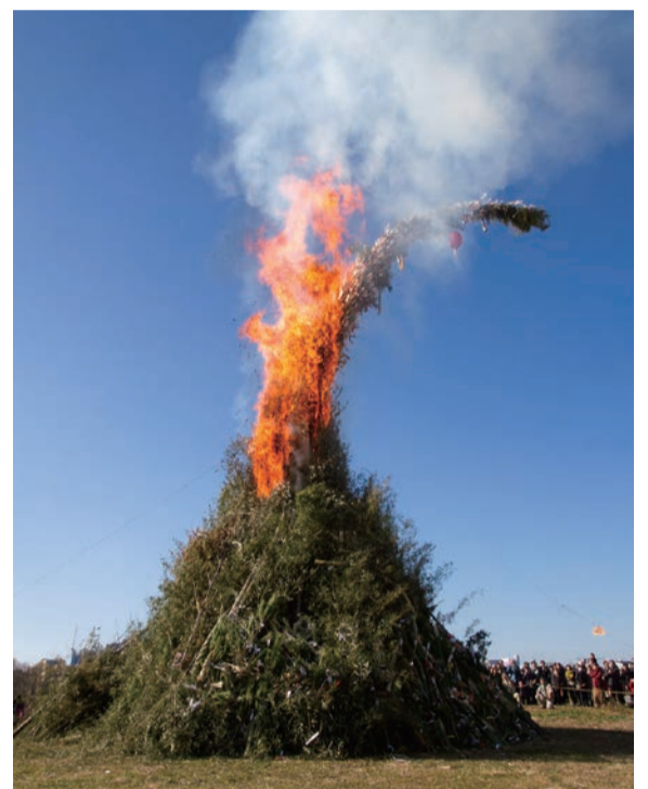
狛江市ボーイスカウト連絡協議会による「どんど焼」