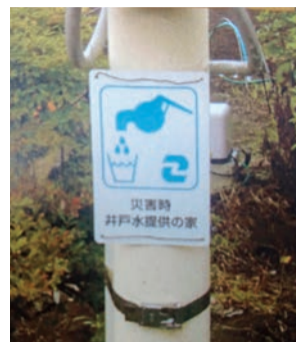
井戸水提供の家表示板

め、井戸を所有している家庭に登録する制度です。登録家庭には表示板またはステッカーを掲示していただいています。