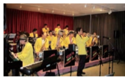
イズミシングオーケストラ