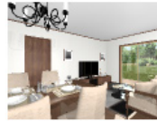
モットクラシック