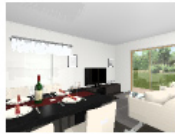
スタイリッシュモタン