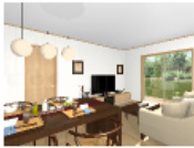
シバノイスモタン