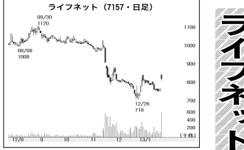
ライフネット (7157・日足)