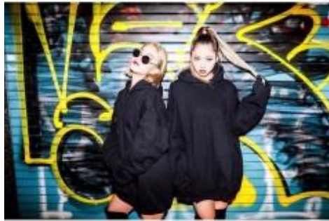
▲関西 A・北陸 B エリア代表「I T I」