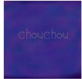
▲関西 B・中国 A・四国エリア代表 「chouchou」