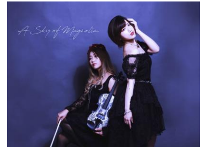
▲関東 B エリア 「A Sky of Magnolia」