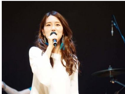
▲関東 C エリア代表「BlueHairs」