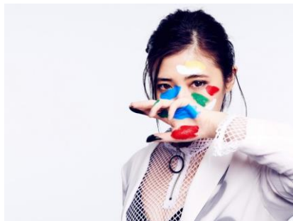
▲九州・中国 B エリア代表「mème」