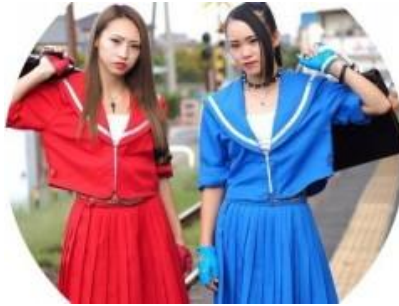
▲関東 A・北陸 A・北信越エリア代表 「木更津発 仏恥義理アイドル C-Style」