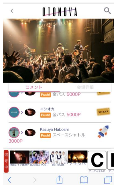
▲ライブ生中継（イメージ）