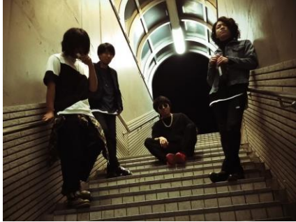
▲北海道・東北エリア代表「Judgement Ship」