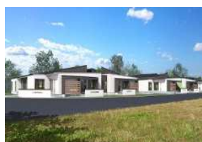
ケアガーデン新幸