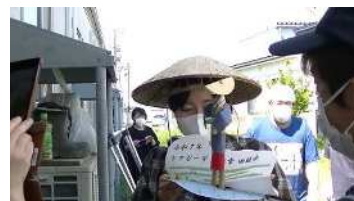
R7.5.13 利用者さんと田植え