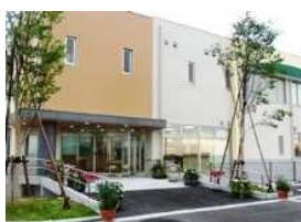
ひだまりキッズクラブ