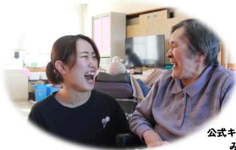
公式キャラクター みこちゃん