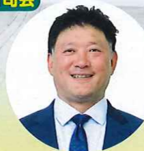
いまいずみ きよし 今泉 清 元ラグビー日本代表