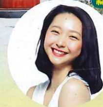
はたけやま あいり 畠山 愛理 元新体操団体日本代表