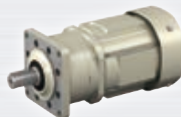
アルタックス ® NEO 40W ~ 3.7kW

SIAAマークとは、SIAA（抗菌製品技術協議会）が制定した抗菌のシンボルマークです。 SIAAが制定した「抗菌性」「安全性」「適正な表示」の3つの基準を満たした製品にのみSIAAマークの表示が認められています。