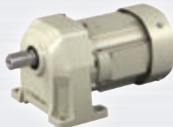
プレスト ® NEOギヤモータ 40W ~ 2.2kW