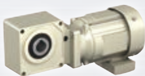
ハイポニック減速機 ® 15W ~ 11kW

ハイポニック減速機 ® 、プレスト ® NEOギヤモータ、アルタックス ® NEOに、オプションとして追加可能です。